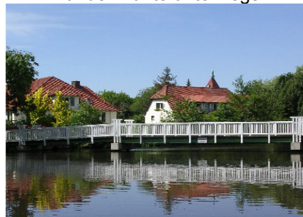
Wildeshausen im Stadtpark