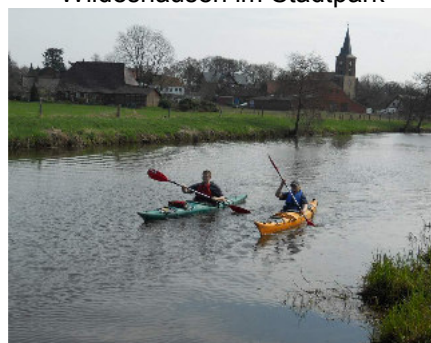
Die Hunte bei Colnrade