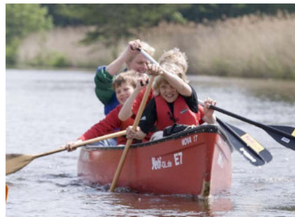
Auf der Hunte unterwegs

Mehr aktuelle Termine und die Möglichkeit direkt zu buchen finden Sie unter www.Yeti-ol.de