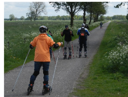
Skiken am Bornhorster See

Gerne reservieren wir Ihre Wunschstrecke zu Ihrem Wunschtermin !