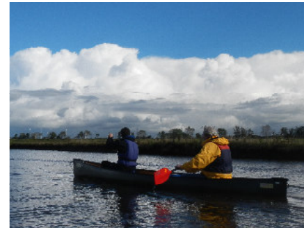
Weiter Himmel in Friesland