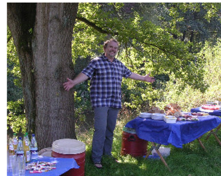
Der Tisch ist gedeckt !