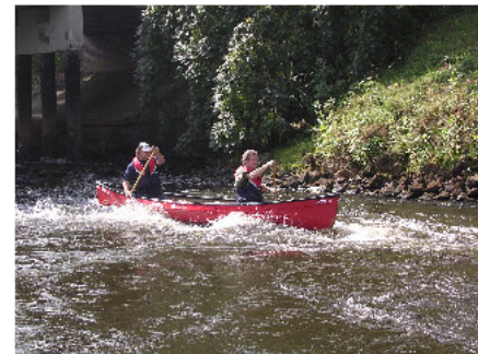
Die Wilde Hunte - kleine Stromschnellen